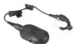
Oreillette sans fil Operations Critical

« Lorsque j'ai découvert la série SL MOTOTRBO, j'ai cru qu'il s'agissait d'un téléphone cellulaire et non d'un émetteur/récepteur radio. Elle offre toutes les capacités d'une radio, associées à un design professionnel et discret qui se marie parfaitement avec tous nos uniformes. »