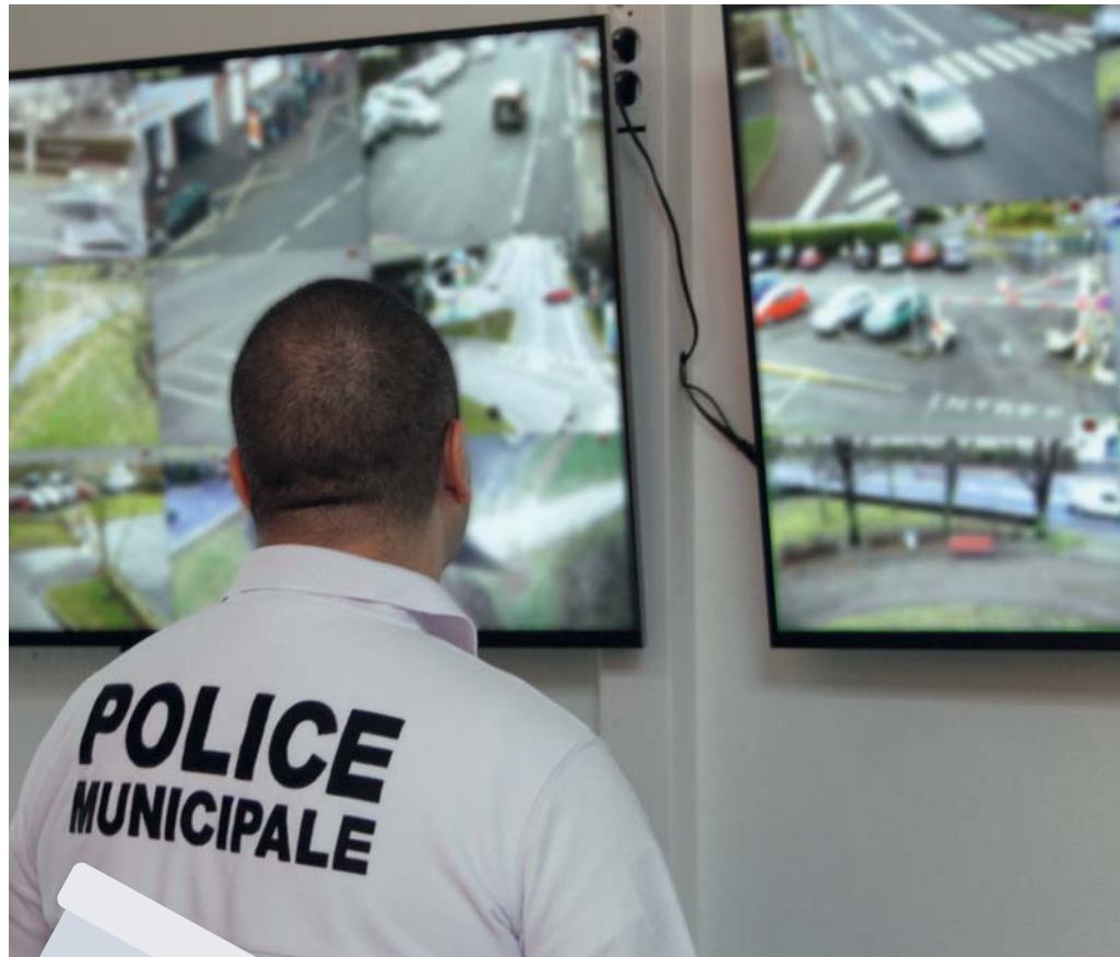
Les écrans du Centre de Supervision Urbaine (CSU)

Depuis cette année, la Police Municipale s'est dotée d'un nouvel agent, dont les sens sont si affûtés qu'aucun de ses collègues ne peut rivaliser. Ce berger malinois est le nouvel équipier à quatre pattes de la Police Municipale. Intégrée à l'effectif afin de renforcer la protection des policiers municipaux, la nouvelle recrue a largement fait ses preuves depuis. Et en effet, lors des différentes interventions auxquelles elle a pris part, ses qualités ont clairement fait la différence. Ses capacités olfactives sans égale permettent d'avertir les agents de la présence d'individus avant même qu'ils n'aient pu les voir ou les entendre. Cet atout offre l'opportunité d'agir en toute discrétion, notamment au sein des caves, sous-sols de logements collectifs et de tout endroit difficile d'accès. Au-delà des avantages permis par ses qualités sensorielles indéniables, ce nouvel agent dispose d'un pouvoir de dissuasion d'une efficacité redoutable. De fait, lorsque l'animal accompagne son maître en intervention, même les individus les plus récalcitrants modèrent leur agressivité et coopèrent davantage. En alerte, vif et doté d'une dévotion sans limites, le chien est le meilleur ami de l'homme en bleu.