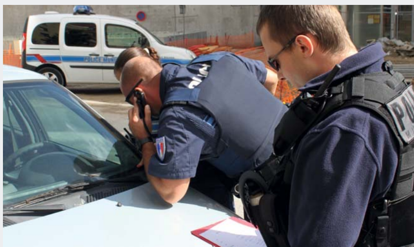
Contrôle des règles de stationnement

Pour effectuer ses missions et améliorer leur réussite, notre Police Municipale procède à un véritable travail de coopération avec la Police Nationale. En effet, l'efficacité des opérations des forces de l'ordre de notre territoire dépend aussi de leur capacité à transmettre des informations. C'est ce que s'emploie à faire votre Police Municipale. Notamment lorsqu'elle transmet des informations au commissariat de Longjumeau au sujet de manifestations publiques importantes organisées sur la commune. Les forces de l'ordre sont également amenées à joindre leurs effectifs à l'occasion de manœuvres conjointes comme des contrôles routiers ou des patrouilles de sécurisation. Enfin, une part importante de cette transversalité concerne les faits de délinquance. Certaines données peuvent être transmises au sujet de leur fréquence ou de leur localisation sur le territoire communal. Cette coordination des forces de l'ordre s'applique aussi lors des mouvements de gens du voyage dans les communes et voies de communication alentours.